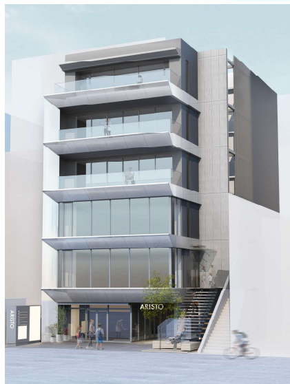
▲リニューアル後のイメージパース▼