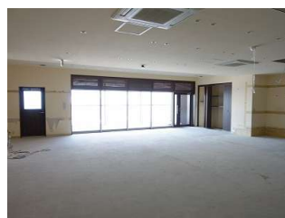
▲現テナント改装前