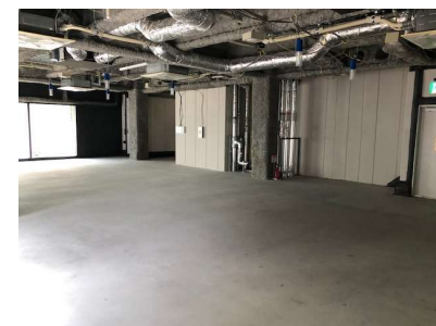
▲2F貸室写真(スケルトン時)