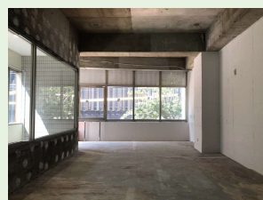
▲2F 現テナント入居時写真