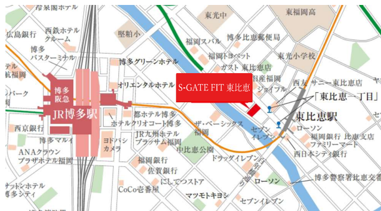
▲案内図 ※地下鉄空港線「東比恵」駅1番出入口徒歩2分