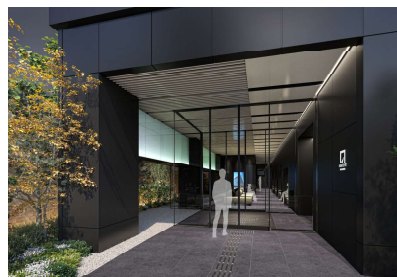
▲1階エントランス(イメージ)