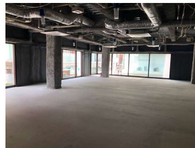
▲2F貸室写真(スケルトン時)