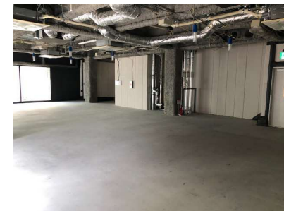
▲2F貸室写真(スケルトン時)