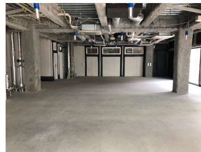
▲2F貸室写真(スケルトン時)