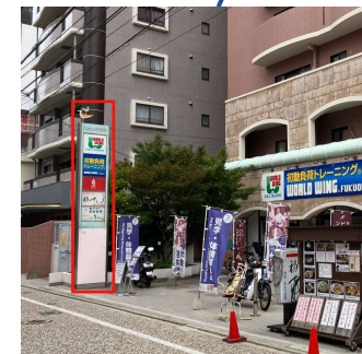
▲商店街側集合看板